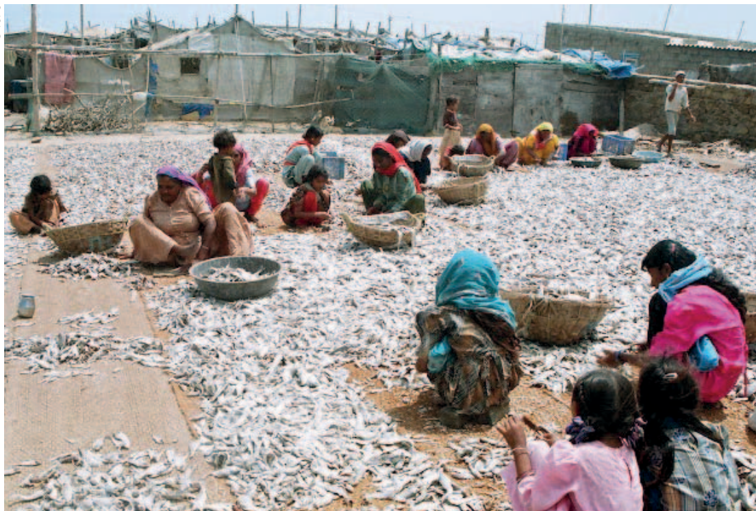
Gujarat, pescadoras clasificando pescado seco