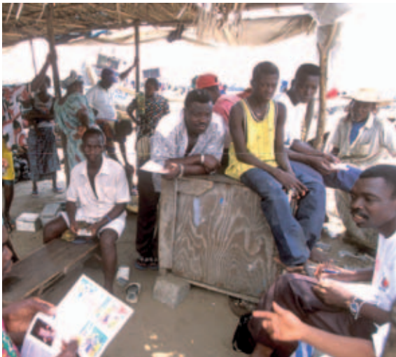
Benín, reunión de gente del puerto

de empleadores y de trabajadores sobre una serie de cuestiones.