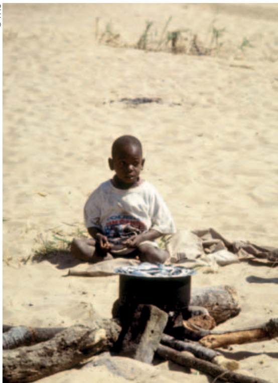
Malawi, niño pequeño esperando pescado que se está cocinando

sean peligrosas. Este tipo de trabajo se convierte en un problema cuando es peligroso, o cuando los niños son explotados o son menores de edad, y cuando interfiere con la escolarización.