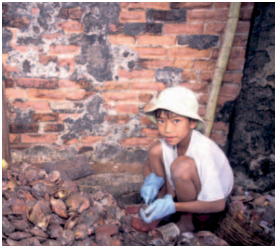
Viet Nam, niño abriendo vieiras

de SST para niños en distintos tipos de lugares de trabajo relacionados con la pesca. Estas listas proporcionan un sistema fácil para evaluar el cumplimiento y la toma de conciencia de los reglamentos sobre el trabajo infantil, mediante la determinación de los peligros, los riesgos y las medidas de seguridad adoptadas en el lugar de trabajo, y con verificación de la disponibilidad de servicios para el bienestar del personal (tales como agua potable). Una vez llena la lista, se puede utilizar para tomar una decisión sobre las cuestiones prioritarias (IPEC-ILO Cambodia, 200325).