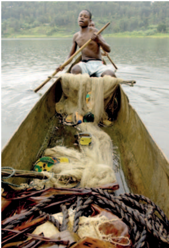
República Democrática del Congo, niños ex soldados, canoas y redes de pesca recibidas al final de una capacitación en el lago Kivu