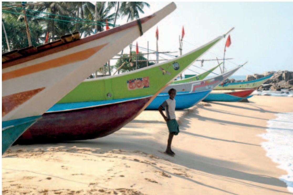
Sri Lanka, aldea de pescadores después del tsunami

y en el lago Volta, las niñas practican las actividades postcaptura (como, por ejemplo, clasificación, ahumado y venta) además de cocinar, hacer trabajos agrícolas y mandados. Los niños también pueden cocinar y hacer encargos, pero a menudo se ocupan más bien de remar, tirar de las redes, bucear y trasladar cargas. En el lago Volta, algunas niñas también van de pesca y bucean, lo que incrementa todavía más su jornada laboral, ya que su participación en expediciones de pesca no las excluye de las tradicionales actividades postcaptura por lo general reservadas a las mujeres y las niñas (ILO, 2007; Afenyadu, 2010).