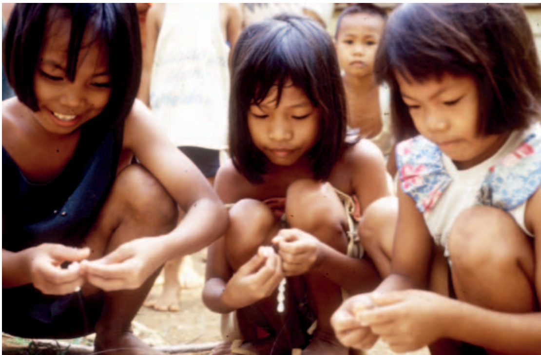
Filipinas, niñas limpiando pequeñas conchas marinas

nacionales reflejan adecuadamente la movilidad regional.