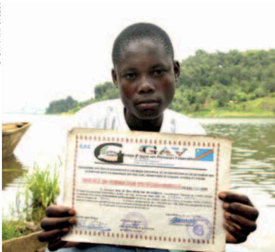
República Democrática del Congo, certificado de formación profesional

funcionado bien para la agricultura en diversos países y se está preparando un sistema similar para el sector de la pesca y la acuicultura (Véase el Recuadro 16).