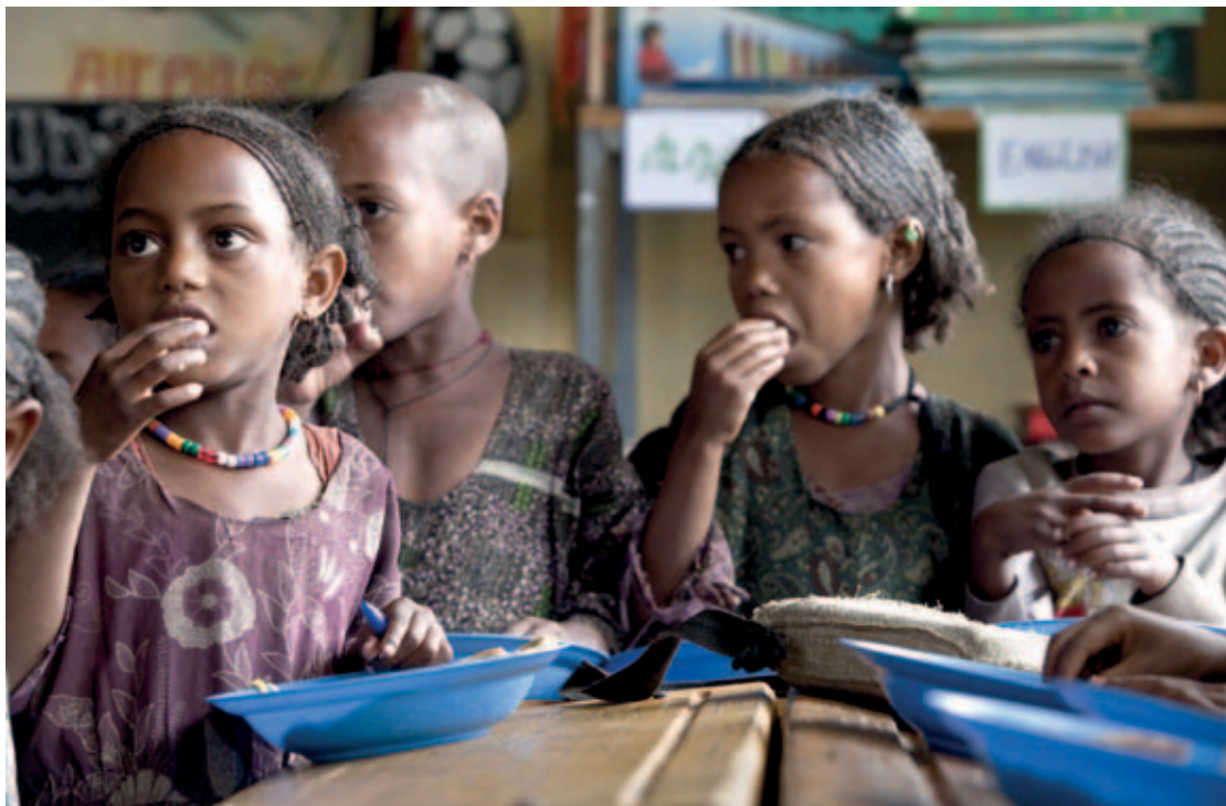
Etiopía, niños tomando el almuerzo escolar

tal, exige un enfoque integrado. 27 En muchos casos, es necesario mejorar la gestión de la pesca y fomentar la pesca responsable, entre otras cosas mediante una mayor participación de las organizaciones de pescadores, acuicultores, trabajadores de la pesca y empleadores, así como de otras instituciones del sector. Los pescadores en pequeña escala, los trabajadores de la pesca y sus comunidades necesitan que se garanticen sus derechos a los recursos pesqueros de los que dependen, así como de la tierra en las zonas costeras. Sin embargo, la sostenibilidad de los recursos no siempre es la principal preocupación de las comunidades de pequeños pescadores; pueden enfrentar problemas más acuciantes en cuanto a sus necesidades diarias, problemas de salud y falta de servicios sociales. Por lo tanto, los esfuerzos por lograr una pesca responsable y una acuicultura sostenible deben aunarse al desarrollo económico y social a fin de crear los incentivos y la capacidad para participar