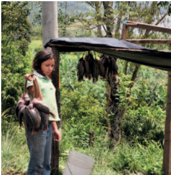
Nicaragua, muchachita secando pescado

así como descuido” (ILO, 2000, Recuadro 2.1 18 ). El Recuadro 5 presenta estadísticas sobre los accidentes mortales en la pesca en los Estados Unidos de América.