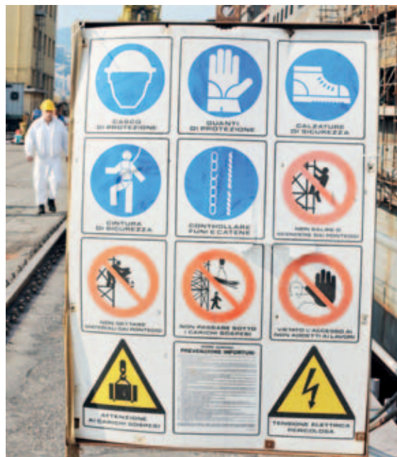
Puerto de Génova, letreros de la normativa de seguridad en los sitios de construcción de barcos

Hay orientación sobre evaluación de riesgos en los barcos pesqueros en los instrumentos vinculantes y voluntarios de la OIT, la OMI (Organización Marítima Internacional) y la FAO, a los que se hace referencia en este documento. De conformidad con el Convenio sobre el trabajo en la pesca, 2007 (núm. 188), las autoridades del gobierno deberán establecer el marco necesario para garantizar que “a los propietarios de buques pesqueros, capitanes o patrones, pescadores y demás personas interesadas se les proporcionen orientaciones, materiales de formación y otros recursos de información suficientes y adecuados sobre la forma de evaluar y gestionar los riesgos para la seguridad y la salud a bordo de buques pesqueros” (Artículo 32). Por otra parte, en el tema de las revisiones médicas, el Convenio núm.188 estipula que, en general, y en particular para los trabajadores a bordo de los buques de 24 metros de eslora que