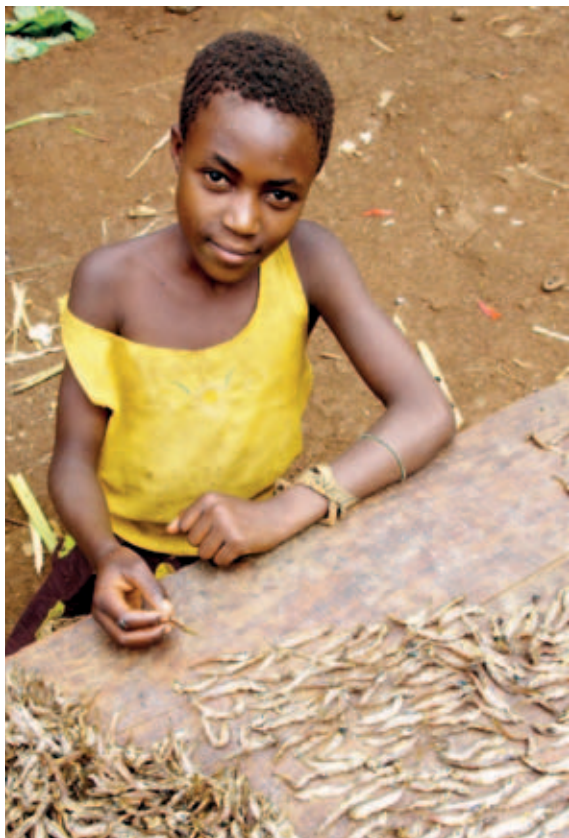
República Democrática del Congo, niña clasificando pescado seco

la pesca excesiva y la utilización insostenible de los recursos siguen reforzando el círculo vicioso.