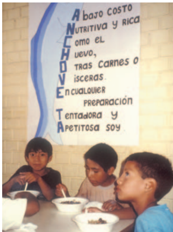
Perú, niños comiendo anchoas

Las leyes y los reglamentos sólo surtirán efecto si se aplican. Los gobiernos son responsables de garantizar que haya medidas y marcos adecuados vigentes, mientras que la eficacia de la aplicación depende de los incentivos. Éstos pueden ser negativos, en la forma de sanciones por incumplimiento, o positivos, que induzcan la conducta deseada. Los estudios demuestran que es más eficaz la combinación de distintos incentivos pertinentes a y basados en la comprensión del contexto nacional y local (Tabatabai, 2003). Es posible que sea necesario reforzar la inspección del trabajo, el control por el Estado del puerto, los controles fronterizos y otros