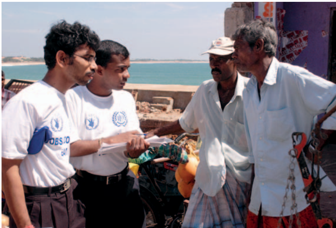
Sri Lanka, encuesta posterior al tsunami

fin de obtener información representativa sobre los puntos específicos de interés.