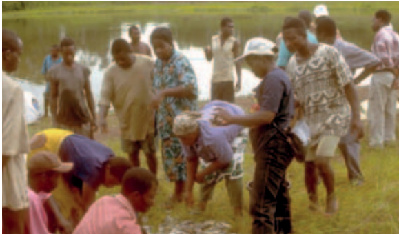
Ghana, piscicultores repartiendo la pesca

La última categoría (d) es lo que generalmente se conoce como “trabajo infantil peligroso” o “trabajo peligroso”.