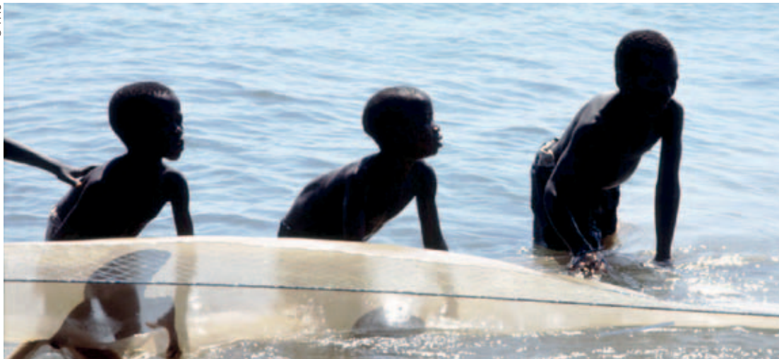
Malawi, niños tirando de una red