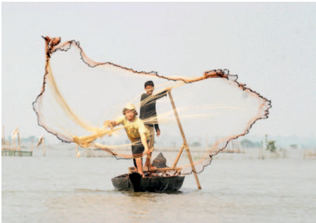
Camboya, dos niños pescando